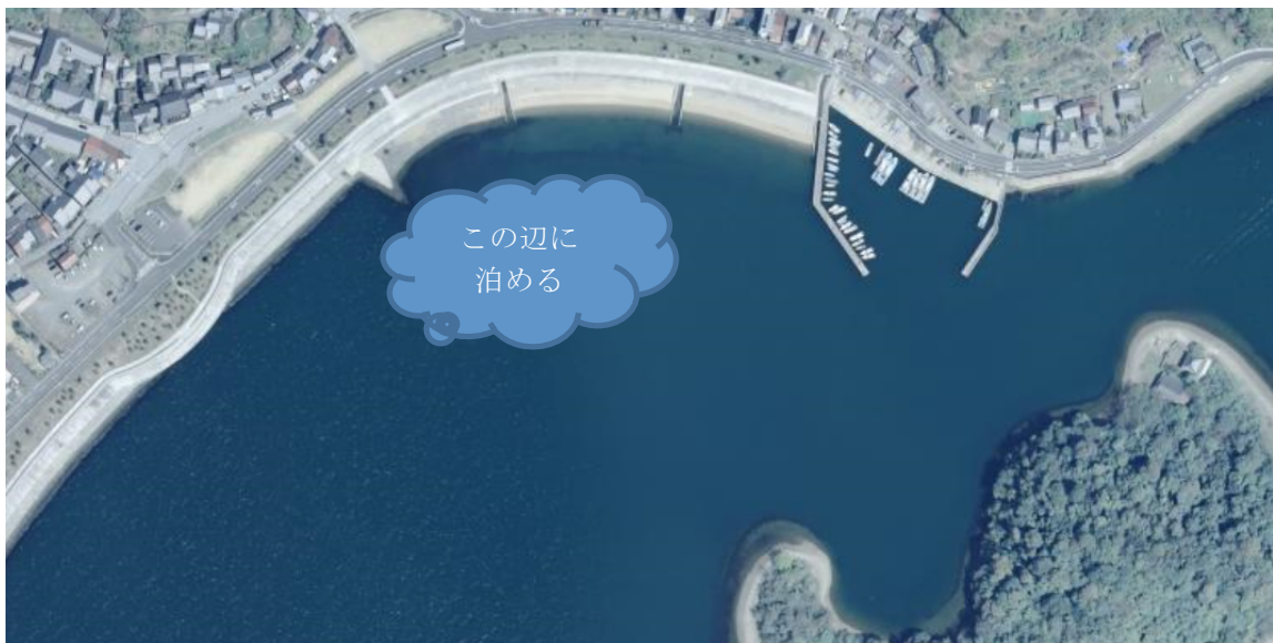
相生（坂越湾）の潮汐（入出港関係時刻を抜粋しています）