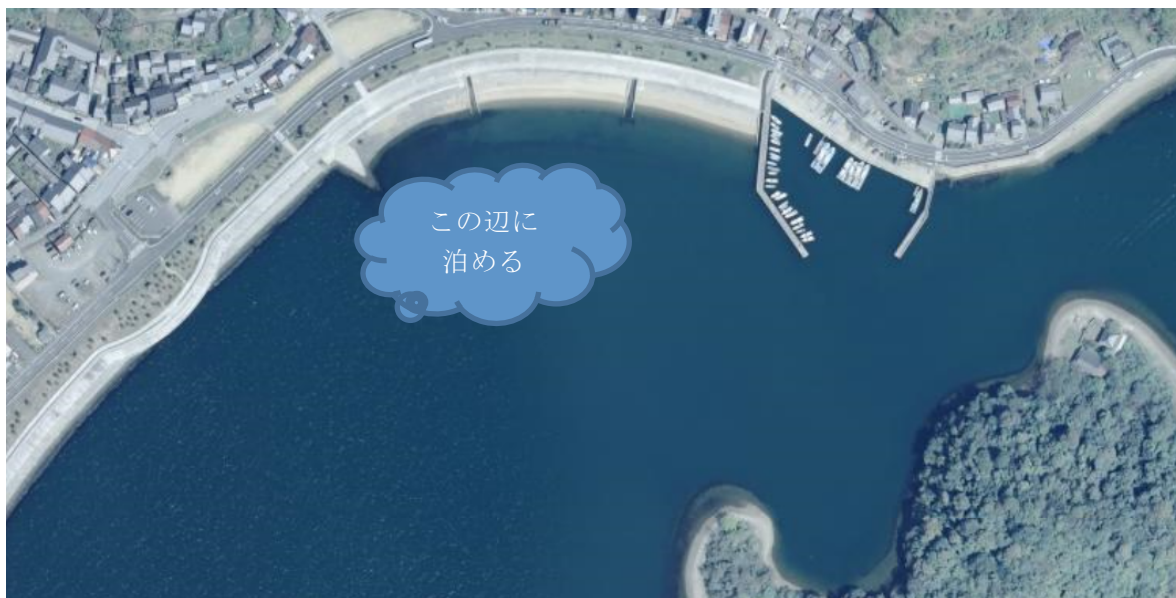
相生（坂越湾）の潮汐（入出港関係時刻を抜粋しています）